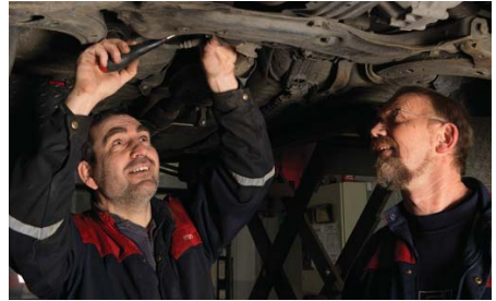
Arbeidspraksis på bensinstasjon er et av Duraparts tilbud.

Kort oppsummert var fjoråret et svært godt år resultatmessig med tanke på formidlinger. Det mest gledelige er at antall personer i "tyngre" attføringstiltak som fikk jobb, økte med 34% fra 2006. I snitt var 54 personer ute på arbeidspraksis i eksterne bedrifter hver eneste måned. Vi benytter anledningen til å takke alle våre 450 næringslivskontakter for et svært godt samarbeid!