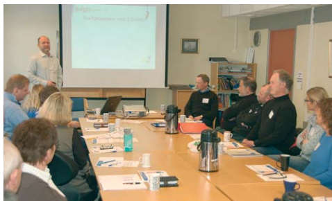
Deltakere fra hele 9 bedrifter deltok på seminaret.

Deltakerne fanget fort interesse for de muligheter et slikt kvalitetssystem gir og alle ønsket å gå tilbake i egen bedrift for å starte arbeidet. Grimstad ASVO tar initiativ til et oppfølgingsmøte i løpet av sommeren.