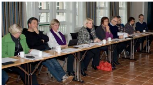
Deltakere fra Agder Renovasjon, RTA og Durapart.

ekstra dimensjon i kompetanse – og erfarings-utveksling.