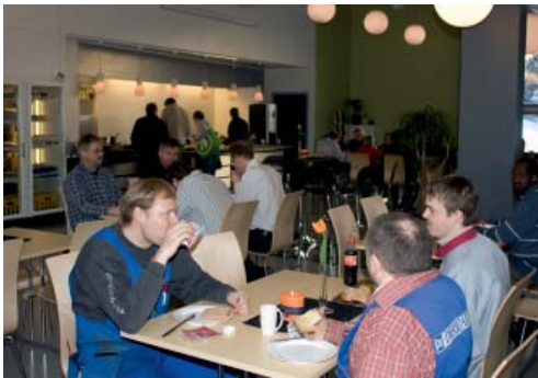
Frokost i den "nye" kantinen.

De gamle lokalene i kjelleren som tidligere huset mekanisk avdeling, er nå pusset opp og tatt i bruk av Profilsenteret. Profilsenteret framstår nå som en moderne og allsidig profesjonell leverandør av skilt, profilering og trykksaker. Mange arbeidssøkere prøver seg allerede i det spennende miljøet.